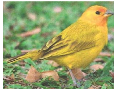
Safranammer oder Safranfink Sicalis flaveola

Herkunft: Südamerika von Venezuela südwärts bis Uruguay und Argentinien anzutreffen.